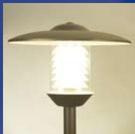
CAMILLO 6005 must