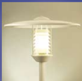
CAMILLO 8000 valge