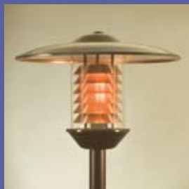
CAMILLO 6000 vask