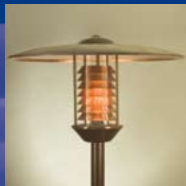
CAMILLO 8005 vask