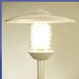
CAMILLO 6002 hall